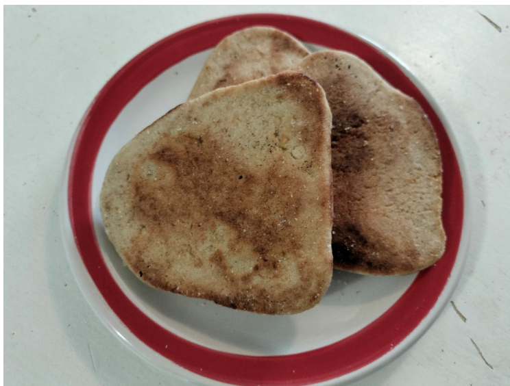
Figura 1. Tlaxcales , Ciudad de México.

En algunos recetarios se menciona que los Tlaxcales se pueden elaborar con maíz recio, con elotes semiduros o con elotes tiernos. En el recetario Hijos del maíz. Cultivo de antaño, herencia cultural , se incluyó una receta de Tlaxcales que enlista elotes tiernos, mantequilla, crema, azúcar y carbonato. Una vez desgranados los elotes, los granos se muelen en molino (de mano), se le agregan los otros ingredientes y con la masa que se obtiene, se van tomando pequeñas porciones a las que se les da una forma triangular delgada y se cuecen en el comal (Contreras, s/f, p. 111). Las formas de los Tlaxcales cambian según la región, pueden ser triangulares, circulares, cuadrangulares, y pueden ser gruesos o delgados, pero siempre pequeños.