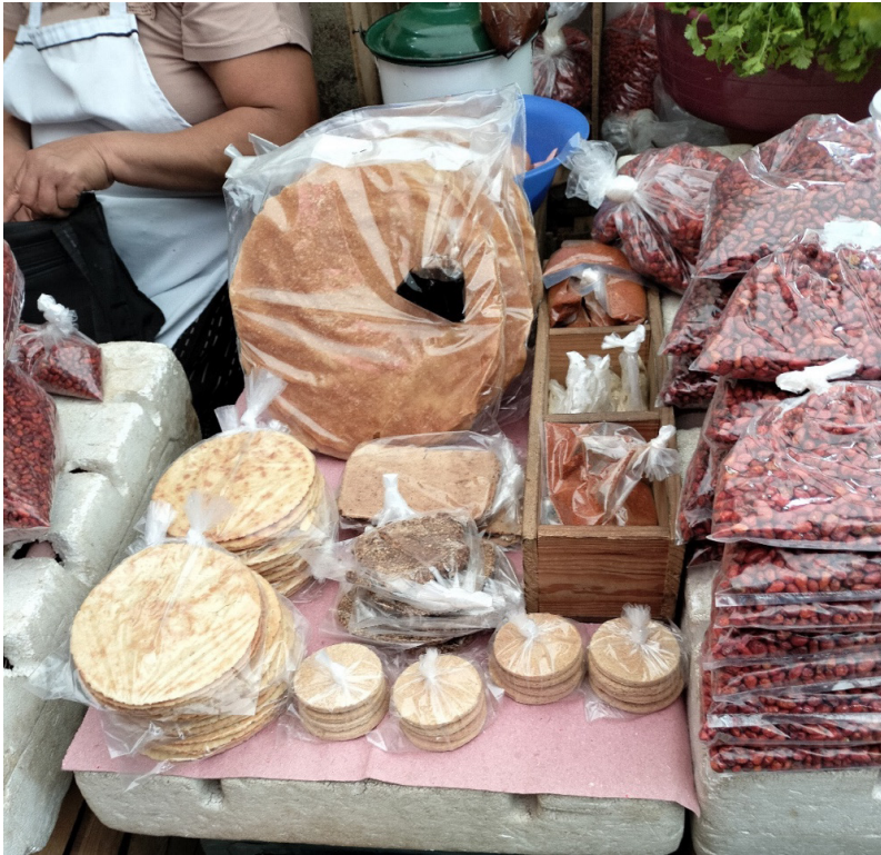
Figuras 3 y 4. Venta de tintines, pemoles y totopos en los puestos de las tineras, Papantla, Veracruz.