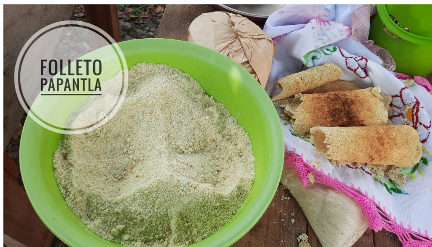
Figura 5. Tasbúyujun o “tortilla regada”, Poza Larga, Papantla.

Para el caso de los pueblos totonacos de la costa veracruzana, se dice que el Taspuyujun o garapacho se comía en Cuyuxquihui, una localidad que se localiza a unos 22 kilómetros de El Tajín; los habitantes lo recuerdan como “una galleta salada de maíz que muchos comían con café de maíz” 13 (Paradowska, 2013, p. 228). Hoy día, en la localidad de Poza Larga, ubicada a unos 19 kilómetros de El Tajín, se prepara el Tasbúyujun o “tortilla regada”, se elabora con maíz nixtamalizado seco, sal o azúcar, se cuece en el comal y su consistencia es tostada y crujiente (Folleto Papantla, 2022, 1m08s).