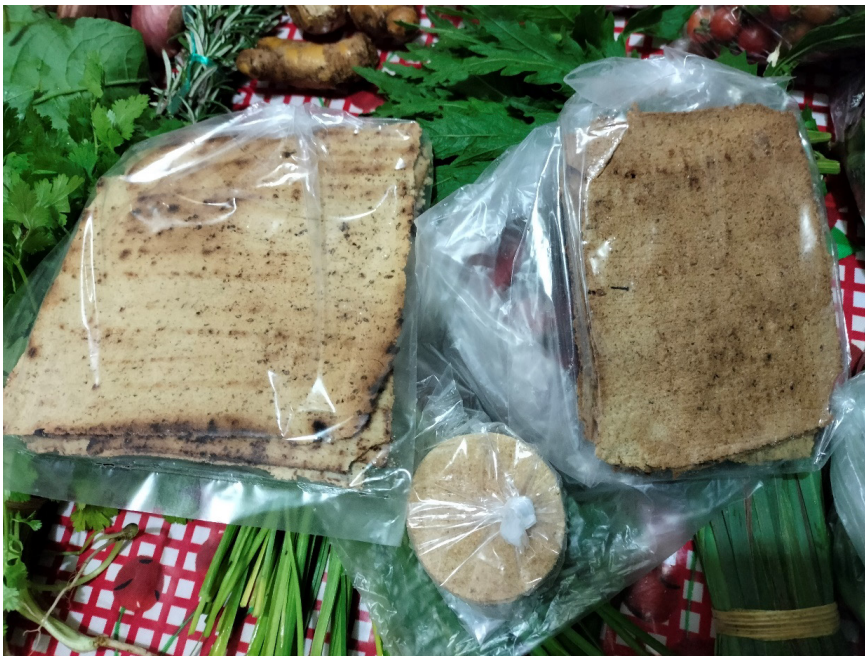
Figura 2. Totopos de maíz, Papantla, Veracruz.

Los totopos se preparan con maíz, una vez molido, la masa se pone a secar, después se le agrega piloncillo, anís molido y manteca de cerdo (es opcional añadir canela). 10 La elaboración es complicada, una vez que se incorporan todos los ingredientes se debe extender sobre un metate de piedra y se va alisando hasta dejar una capa muy delgada, se le da forma de cuadro con un cuchillo, de unos 15 a 10 centímetros, luego se retira con la ayuda de una varita de tarro (una especie de bambú) previamente cortado en forma de cuchillo. Se cuecen en un comal de barro caliente, pero con fuego suave, deben quedar doraditos de ambos lados (Aguilera, 2000, p. 164, Bernabé de García Pando, 1992).